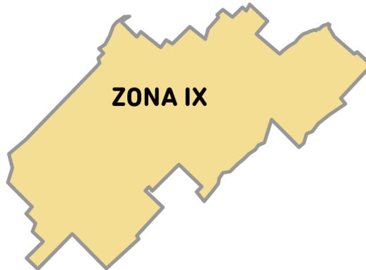
Imagen 2. La Zona IX está conformada por los Partidos: Azul, General Lamadrid, Laprida, Olavarría, Rauch, Tapalqué.